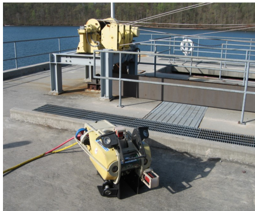
Vehículo de Inspección con Sonar y Luz Adicional

La ventaja Hibbard ofrece a vuestra empresa es que además de operadores sumamente cualificados y con años de experiencia, una amplia variedad de vehículos y sensores que se templan a cualquier nivel y longitud física del proyecto. Nuestro objetivo es siempre entregar datos útiles a nuestros clientes al menor costo. Si usted tiene una inspección, proyecto de retiro de ruinas, evaluación de vida útil (estructural), o una instalación de mamparo y no quiere desaguar o realizar asiento limitado por favor póngase en contacto con nosotros para una cotización.